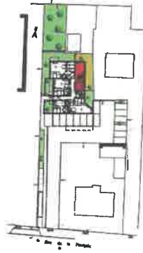
Situation du Logement