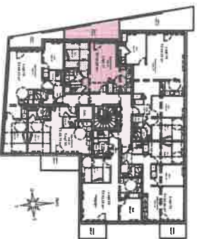
Situation du Logement