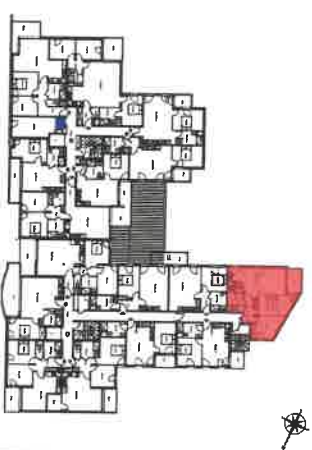
Tableau des surfaces