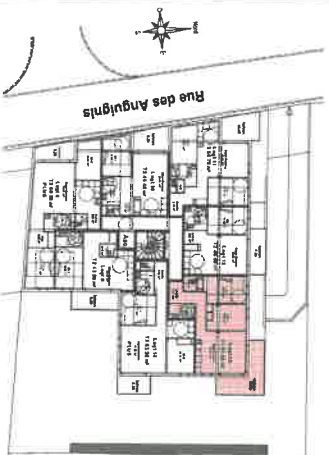
Situation du Logement